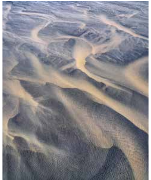
핫셀블라드로 바라본 세상